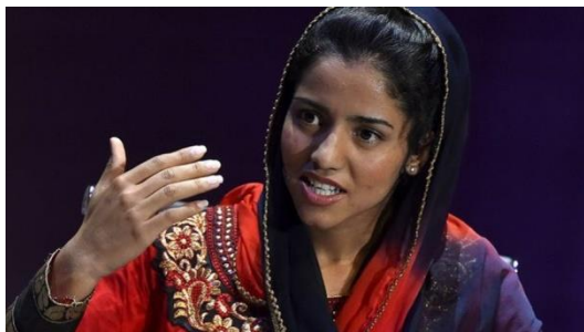
Sonita Alizadeh – ativista afegã

Leia um trecho de uma entrevista de Sonita Alizadeh, ativista afegã que busca acabar com o casamento infantil: